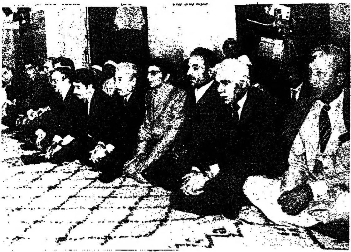
الرئيس الجزائري الشاذلي بن جديد (الثاني من اليمين) ورئيس الحكومة الايرانية محمد علي رجائي...